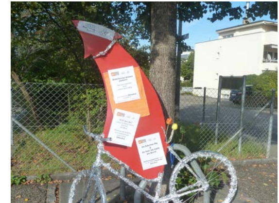
Velo mit Werbesprüchen