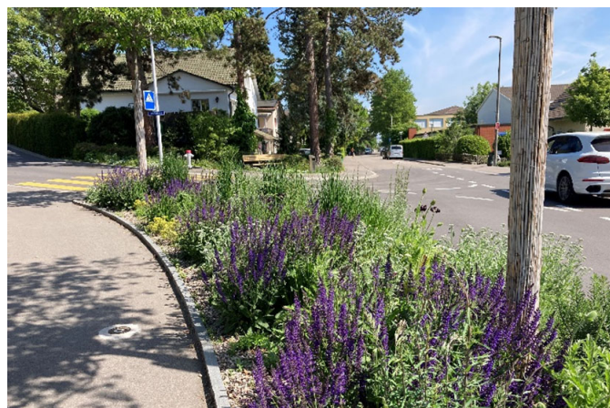
Strassenrandfläche am Hinterlindenweg: Reinach legt auf den gemeindeeigenen Flächen grossen Wert auf eine naturnahe Gestaltung.