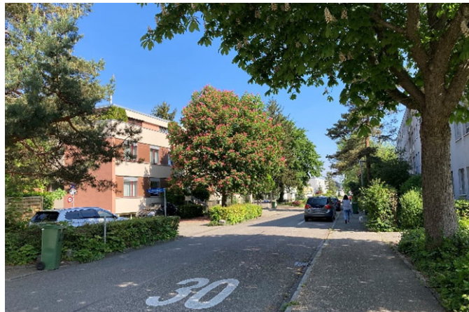
Bäume prägen das Stadtbild und spenden im Sommer willkommenen Schatten.

Bei grösseren Bauvorhaben, z.B. Neubau eines Mehrfamilienhauses, ist ein Umgebungsplan Teil der Baubewilligung. Die Bestandteile des Umgebungsplans, z.B. Grünflächen und Bäume, müssen langfristig erhalten und bei mangelnder Vitalität ersetzt werden.