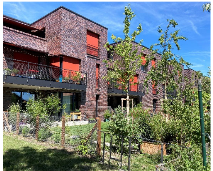
Moderne Reihenhäuser im Stockacker mit naturnaher, vielfältiger Umgebungsgestaltung.