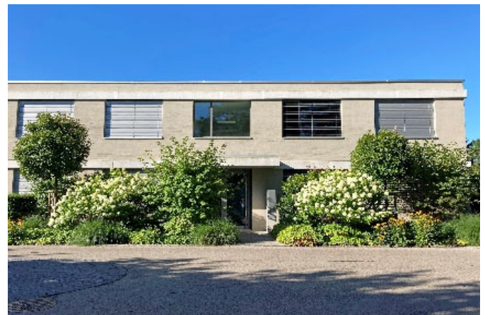
Grüner Vorgarten, gute Einpassung ins Quartier: Beispiel an der Schönenbachstrasse.

Das Zonenreglement Siedlung enthält zum Schutz der Stadtnatur Vorschriften zur Umgebungsgestaltung. Diese sind auch dann zu beachten, wenn für Ihr Vorhaben keine Baubewilligung benötigt wird. Z.B. darf ein grüner Vorgarten nicht ohne Weiteres versiegelt werden.