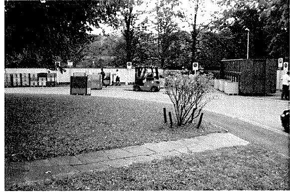
Mobiler Recycling-Park in Riehen: Einmal im Monat steht der Bevölkerung diese Infrastruktur zur Verfügung